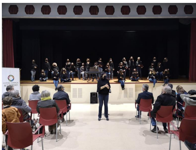
19/12/2021 Concert de Nadal de l'Alt Penedès a les Cabanyes

El concert va estar pendent fins a l'últim moment per causa de les restriccions de la covid, però finalment es va poder realitzar amb públic i cantaires amb mascareta